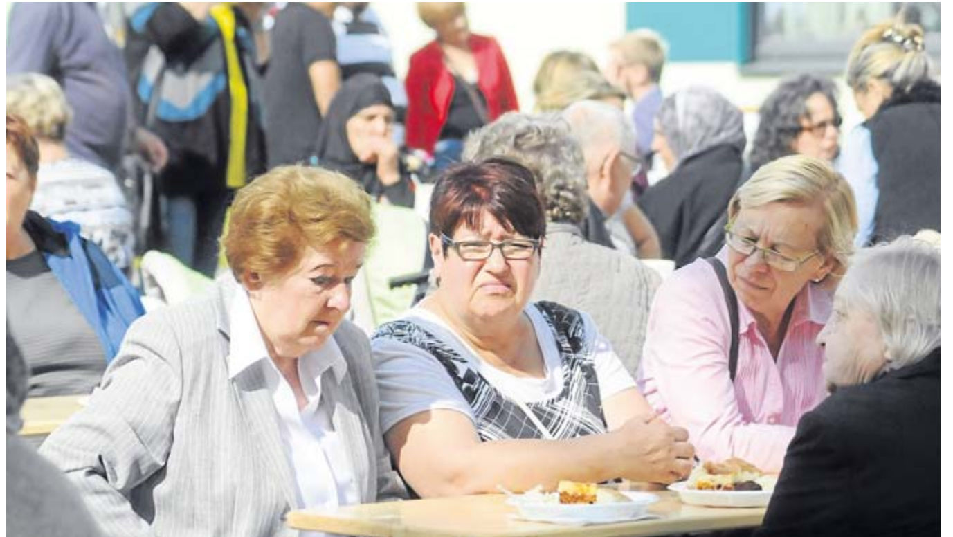
Bunt gemischtes Publikum beim Stadtteilfest in Habinghorst.

Matentzoglou war über die Zusammensetzung der Besucher begeistert: „Es sind viele neue Gesichter dabei, auch viel mehr Deutsche als an der Ohmstraße.“ Und diese durf-